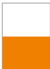
1/2 Seite quer 148 x 105 mm